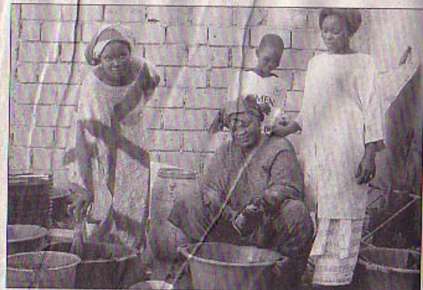
Frauen beim Färben von Stoffen. Die zahlreichen Färbereien befinden sich in den Vororten von Dakar meist auf öffentlichen Plätzen oder unbauten Parzellen.