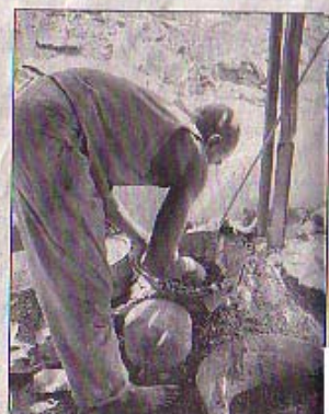
Das Aluminium wird im Feuer geschmolzen und zu Kochtöpfen gegossen.