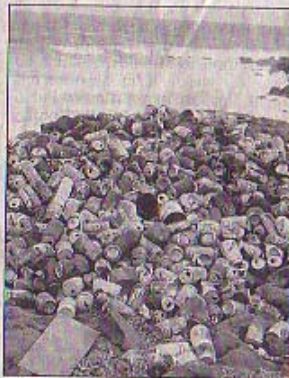
Berg von Aluminiumdosen auf der Touristeninsel N'Gor bei Dakar.